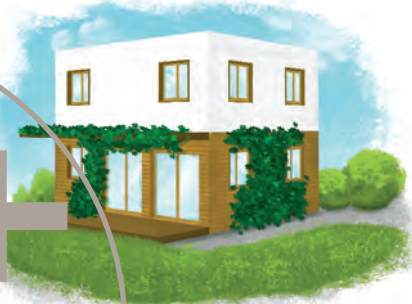
variante à énergie positive